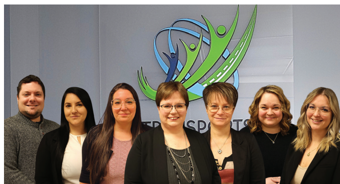
L'équipe de travail du transport collectif au 31 décembre 2024.

équipe regarde vers l'avant avec une expérience cumulée de plus de 60 ans de transport pour les gens d'ici.